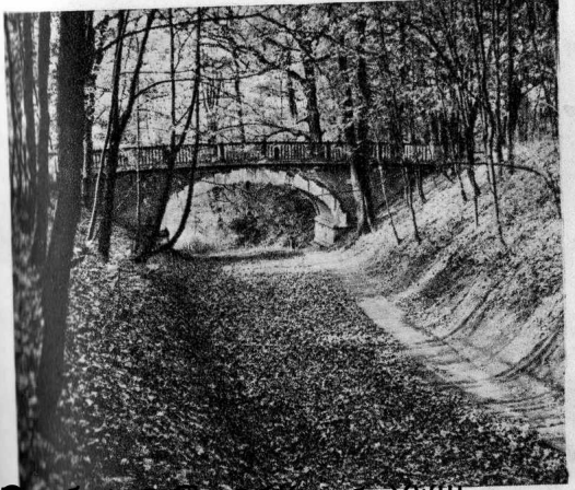
Мостик через ручей в саду усадьбы Суханово. Мостик построен в 1890-е гг. Мостик имеет форму полукруга и выполнен из камня. Мостик является одним из архитектурных элементов усадьбы.