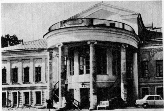
Суханово. Ротонда усадебного дома.